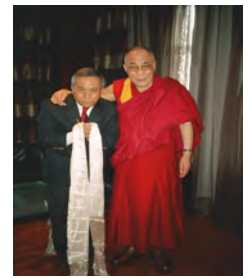
Soutien de l'identité tibétaine; échanges culturels; actions humanitaires; élaboration, réalisation et développement de projets en faveur du peuple tibétain, au Tibet et en exil

Association Loi 1901 - oeuvre d'intérêt général - publication au J.O. le 01.12 2007 sous le n° 1996.